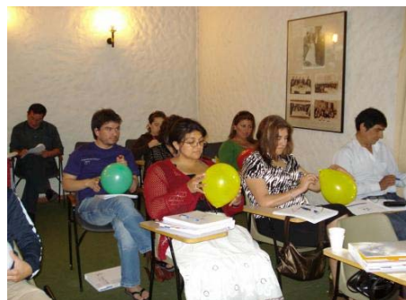
Profesores y alumnos durante las sesiones y los talleres

Se trata de proporcionar una educación a los adolescentes, en cooperación con sus padres, basada en la dignidad de la persona humana. La sexualidad es entendida como un factor que incide en toda la persona, abarcando aspectos físicos, intelectuales, emocionales, sociales y espirituales. La finalidad es que los jóvenes estén informados y sean libres y responsables en las decisiones que atañan a su identidad y salud personales. Por esto va dirigido a profesionales del mundo sanitario y educativo.