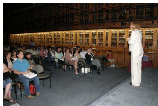
Una de las sesiones – conferencias